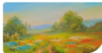
Gattini AS-23-24 scuola giarolo • 3g