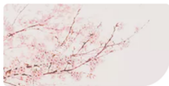
Giraffe AS.23-24 scuola giarolo • 16h