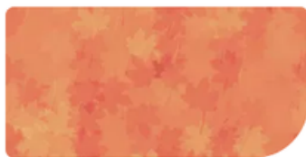
Lemuri - AS.23-24 scuola giarolo • 3g